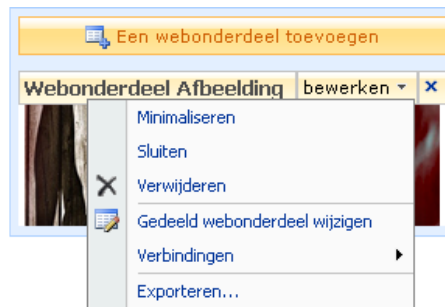
Afbeelding 4.1 Een webonderdeel exporteren